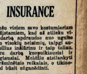
JOSEPH DABRAVALCKIS (DOBROW) 580 Grand St., Brooklyn, N. Y. Telephone: Stagg 6862