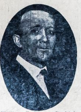
William Z. Foster, Darbininkų Partijos kandidatas į Jungtinių Valstijų prezidentus.

Reakcionieriai išmetė iš kuopos 36 narius. Tuo būdu nariai buvo priversti eiti į valdišką teismą, kad apgintų savo teises.