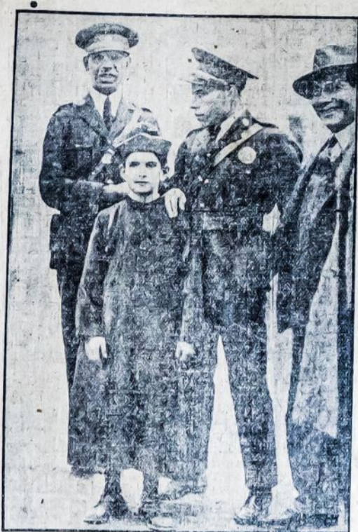
Meksikoj už kontr-revoliucinį darbą suareštuotas jaunas juodvarnis.