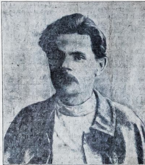
Atvaizdas iš pabaigos pereinio šimtmečio Maksimo Gorkio

Mes neminėsimė visų tų veikalų, kuriuos M. Gorkis yra parašęs. Sunku lietuviams skaitytojams spręsti apie Gorkio veikalus, nes lietuvių kalbon išversta tik mažytėlytė jų dalis.