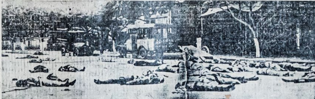
Šiandien šitokios scenos yra paprastas dalykas Činijoje. Bėgyje pastarųjų kelių mėnesių reakciniai nacionalistai, kaip imperialistų agentai, išžudė tūkstančius Činijos revoliucinių darbininkų ir valstiečių. Tik šiomis dienomis Kantone nužudyta suvirš 300 darbininkų. Bet nepaisant kruvino teroro, Činijos darbininkai ir valstiečiai toliau tęsia revoliucinį darbą.

ADP. LF. naujasis Centro Biuras reikalauja finansinės paramos, kad geriau galėtų veikti. Kiekvienam turi būti aišku, kad ir prie geriausių norų be finansų daug negalės nuveikti. Prieš Biurą stovi dideli darbai. Suvažiavimas nutarė budavoti ir stiprinti komunistinį judėjimą. Kiekvienas delegatas, dalyvavęs suvažiavime, neturi pasitenkinti, kad jis balsavo už naujus planus, bet sugrįžęs į koloniją privalo rūpintis, kad visi tarimai suvažiavimo būtų išpildyti. Išpildykime Biuro reikalavimus, kad negalėtų teisintis, jog niekas nerėmė ar kenkė. Paaukaukime po dolerį kitą ant pradžios. Delei dolerio netrukdykime veikimo.