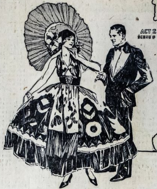
Žvaigždė pirmoji: "Man sakė, kad už pinigų jus bile cigarečių pagirtumėt..." Antroji žvaigždė: "Tikra tiesa, bet tik tada, jei už tuos pinigų lieptų man girti Chesterfield."