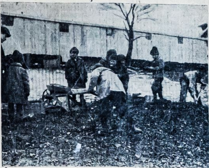
Streikuojančių mainierių vaikučiai rankioja šmotukus anglies kūrenimui pečių savo šaltose sėtrose.