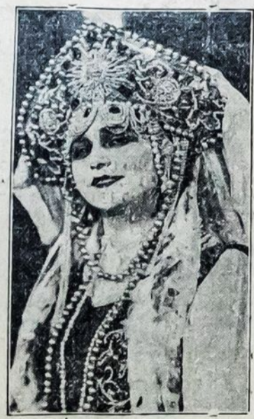
VORONCOVA, rusė lakštingalė, kuri visuomet elektrizuoja publiką.