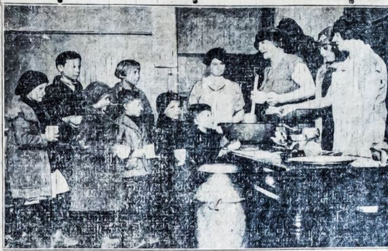
Streikuojančių mainierių badaujanti vaikučiai. Stovi virtuvėj, kad gavus nors prastos sriubos užvalgyt. Nuc išbadėjimo daug main. vaikučių krinta mokyklose.

Copenhagen, Danija.— Norvegijos valdžia priėmė $30,000,000 paskola, pasiūlytą bankinio sindikato, į kurį įeina Gúrantų Trust, Dillon, Read & Company iš New Yorko, ir First National Bankas iš Bostono, ir Hambros Bankas iš Londono.