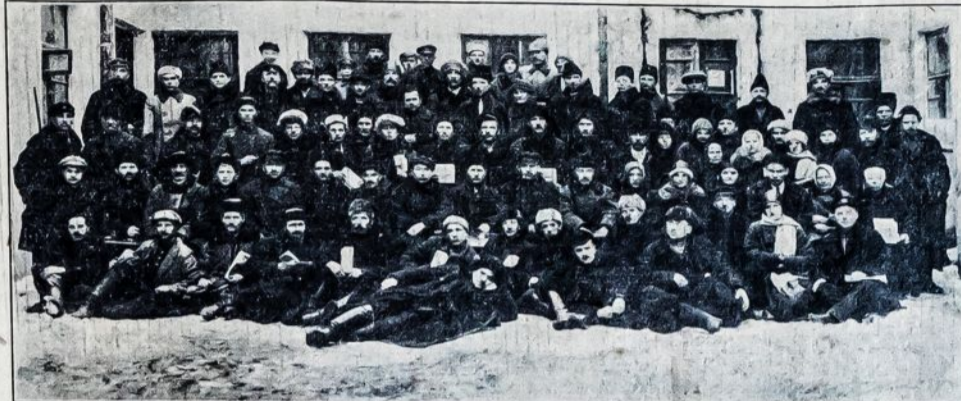
Pirmas Baltarusijos lietuvų valstiečių suvažiavimas Minske, 8 d. sausio, 1928 m. Suvažiavime dalyvavo 70 delegatų su sprendžiamu ir 28 su patariamumu balsu. Ant ketvirto puslapio telpa ilgas aprašymas apie tą suvažiavimą.