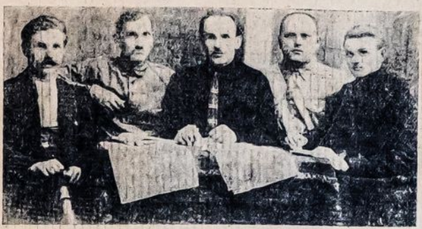
Vitebsko apygardos Lietuvių Biuro nariai (Sovietinėj Baltgudijoje).

Nuo spalvi mėnesio iki 20 d. sausio, pagal "Pravdos" padavimus, padavė prašymus 115,000 naujų kandidatų, kad juos priimtų į eiles Visa-Sajunginės Komunistų Partijos. Didžiūma jų yra proletarai. Atatinamos komisijos darbuoja; vietomis jau 68 nuosimčiai priimta. VSKP. tpliškantas pirma, negu jis tampa priimtas į kandidatų, turi išlaikyti tam tikrą kvota.