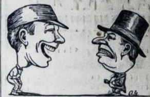
Kam Juokas, o Man Verksmas

Visokių stebūklų pasaulij buvo atsitike, bet dar tokio stebūklo ne tik pasaulis, bet ir visa židukų tauta nėra mačius nei girdėjęs, kad vaikas pagimdytų dukterį! Gal jums iš to juokas, tai galit juoktis, kiek tik jūs šonai leidžia, bet man tai nei biskį ir už tai aš turiu verkti. Ir verkiu ne dėl to, kad man būt ko nors gaila. Visai ne. Aš verkiu, kad visai nekaltai ant mano nelaimingos galvos išaugo keli guzai nuo kočėlo, kuris krito iš mano antros pusės rankų.