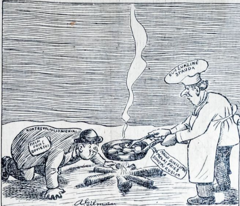
Kontr-revoliucionieriai pučia, o buržuazinė spauda spingina, kepa melus apie "sukilimus" Sovietų Sąjungoje.

HAVANA, Cuba. — Praeitą nedėdinių lakūnas Lindberghas, Wall Streeto "geros valios" ambasadorius, pavežiojo orlaiviu Cubos prezidentą Machado.