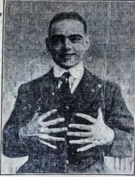
Kartais gi ant abiejų rankų, o kartais ant abiejų rankų ir kojų. Pirštai tie kartais būna anomaliniai (labai maži, neišsirutuloje normaliai). Gi kartais jie būna lygūs visiem kitiem pirštam. Tokia šešiapirš- tybės padėtis yra paveld- jama, persiduoda nuo vie- nos kartos kitai. Žinoma, ne visuomet seka, jog kiek- vieno šešiapirščio tėvo ar motinos visi kūdikiai bus šešiapirščiai. Kartais ta taisyklė persoka vieną ar dvi gentaktes, kol ji vėl pa- sirodo. Kartais to pačioj šeimnoy vieni kūdikiai bū- na normalūs, kiti šešiapir- ščiai. Nesmagumas is to di- džiausias bene bus tik tas,

Veikiausia, ne vienam te- kė matyti žmones su šešiais rankų ar kojų pirštais. Tok- sai anatominis nenormali- mas daktaram žinomas kai- po "Polydactylizmas". Kar- tais žmogus turi vieną ar du pirštu viršaus ant vienos ar kitos rankos arba kojos.