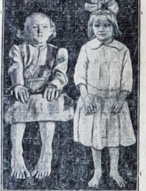
trečiajai paveikslėlis pa- rodo dvi mergaites iš Okla- homos. Viena jų turi po šešis pirštus ant abiejų ko- jų ir rankų, o kita tik po keturis.

Pirmieji du paveikslėliai, tai tikro šešiapirščio vyro. Galite matyti, kaip atrodo jo rankos ir kojos. Jo mo- tina buvo šešiapirštė. Jo kūdikiai taip pat yra pavel- dėtojai kalbamo nenorma- lumo: vienas jų turi po še- šis pirštus ant abiejų kojų ir rankų, o kitas po-septy- nis. Iš amato jisai yra kal- vis, dvidešimt penkių metų amžiaus, buvęs pasauliniu