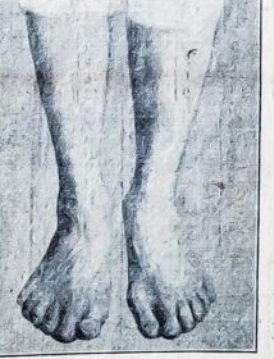
kad tokie žmonės negali gauti sau pirštinių nusi- pirkti. Kojų gi pirštų per-

karo kareivis. Jisai mano, kad tiktai jisai vienas vi- soj Amerikos armijojej tur- jės tiek pirštų.