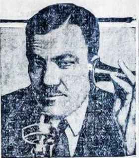
Socialistinis Meksikos prezidentas gen. Plutarco Elias Calles. Jis dabar vis daugiau ir daugiau pradeda patikauti Jungtinių Valstijų imperialistams. Savo delegacijai į Pan-Amerikos Kongresą įsakė nekelti jokių ginčų prieš J. V. imperialistinę politiką lotyniškaj Amerikoj. Nesenai jo administracija pakeitė aliejaus įstatymus, kad patenkinti Amerikos aliejaus interesus.

MASKVA.— Delegacija Sovietų Sąjungos Mainierių Federacijos išvyko į Švediją dalyvauti Sovietų Sąjungos ir Švedijos mainierių komiteto konferencijoj. Apart kitų klausimų, bus apkalbama organizavimas mainierių internacionalo.