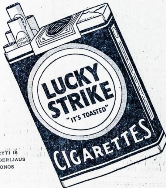
PADARYTI IŠ TABAKO DERLIAUS SMETONOS

"It's toasted" Nei Jokio Gerklės Erzinimo — Nei Jokio Kosulio.