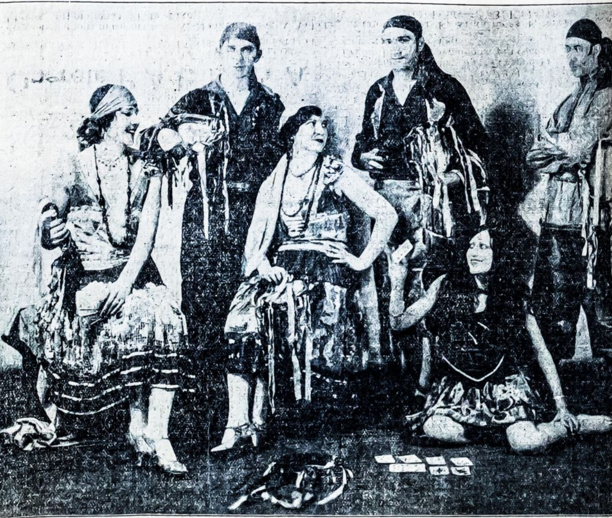
GYPSY VAGABONDS (ČIGONAI KLAJOKLIAI)