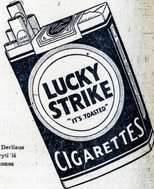
Tabako Derliaus Padaryti iš Smetonos

"It's toasted" Nei Jokio Gerklės Erzinimo — Nei Jokio Kosulio