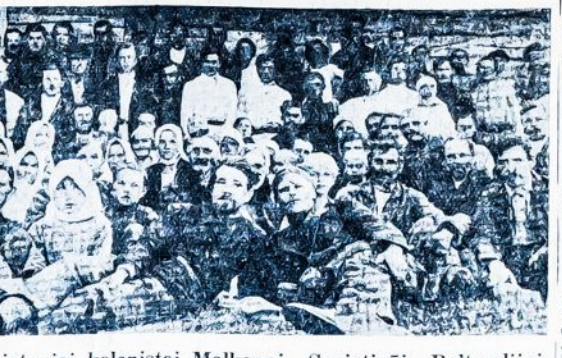
Lietuviai kolonistai Malkovoj, Sovietinėj Baltgudijoj.

Kai kur lietuviška kolo- nija rodėsi atsilikusi, susnū- dusi; bet vienas kitas drau- gas sujudo, — žiūrėk ir ate- ina pora dešėkų naujų "Laisvei" skaitytojų ir kele- tas šėrininkų. Kol draugai nebuvo išban- dę, kalbėjo, kad toj vietoj nieko negalima esą pada- ryt; bet spustelėjo ir ledas pralaužtas, o iš skaitvtųjų kuriasi atnaujintas darbi- ninkiško judėjimo centru- kas. Geriausia, draugai, visi- kai išbraukite iš savo žody- no tą nelabąjį žodį "negali- ma" laike šio vajuas. Tuli draugai gerai nukal- ba ir neblogai parašo, bet praktikos darban nei trukt. Nedrūti, tur būt, yra tokių žmonių principai, kad neišjudina juos praktiskan darban.