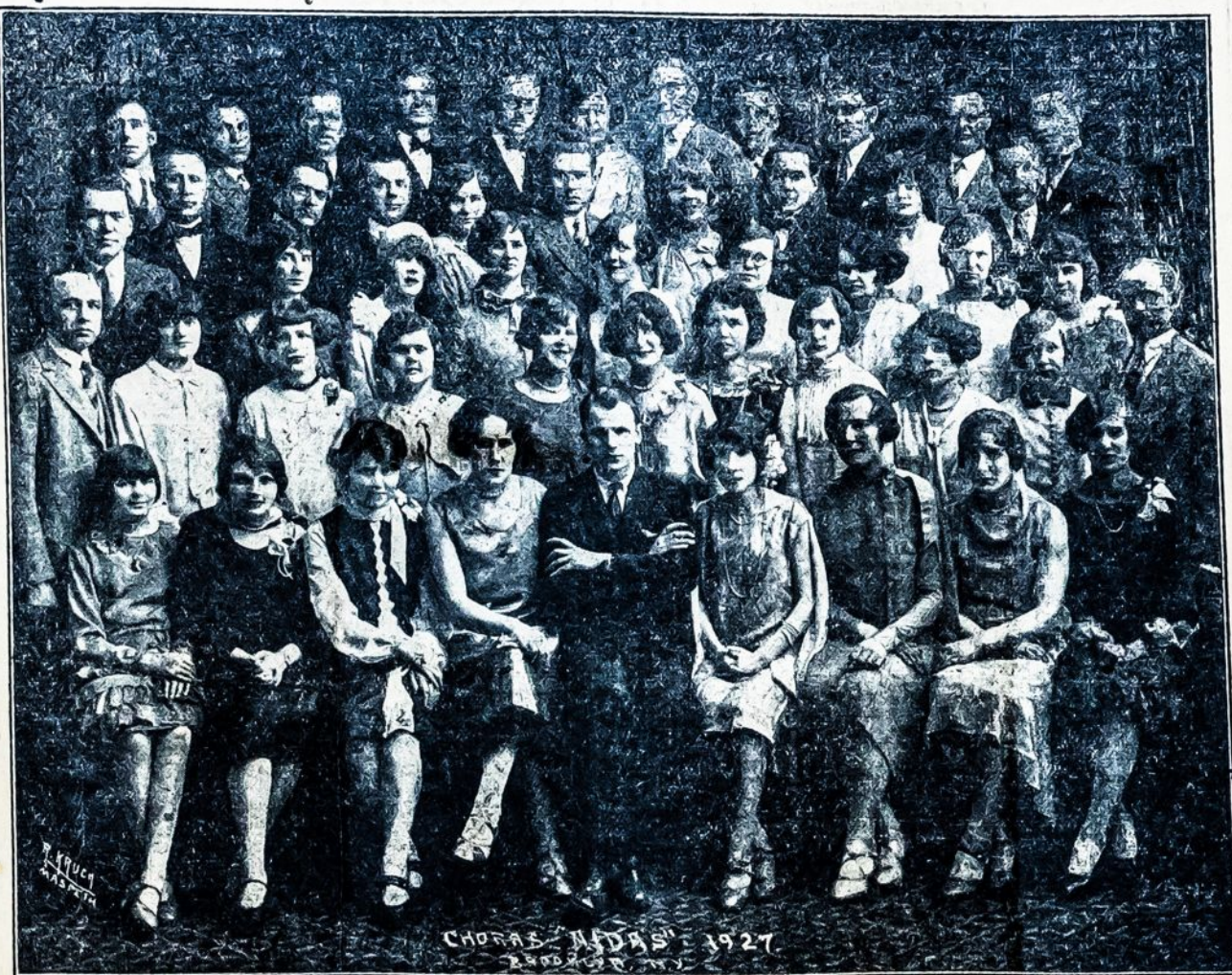
Šie aktorai loš operetę "KOVA UŽ IDEJAS":