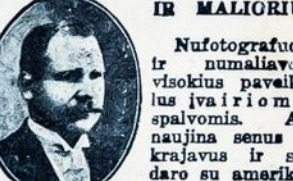
Nufotografuoja ir numaliovoja visokius pavaikalus įvairiomis spalvomis. Atvažiuoja senus ir krajavus ir sudaro su amerikoniškais.

Darbą atlieka gerai ir pigiai. Kreipkitės šiuo adresu: