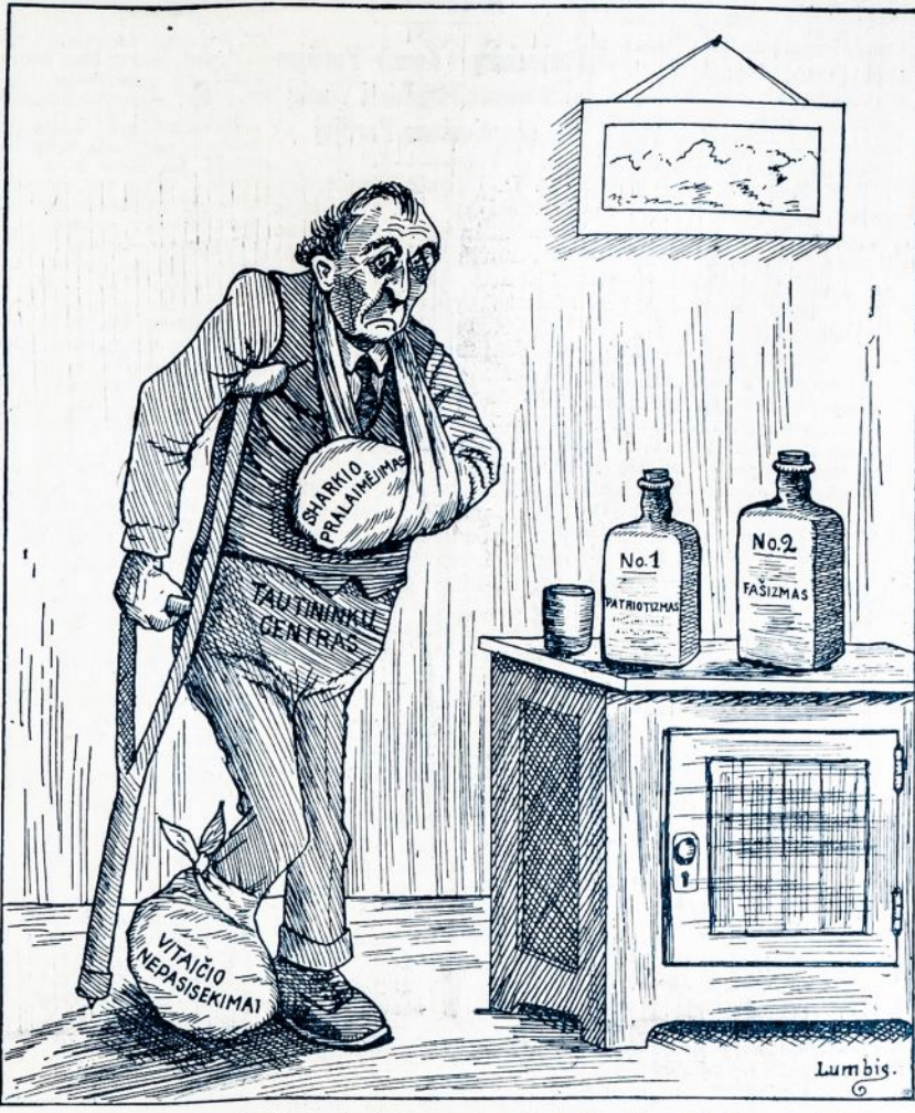
Gyvenimas taip sukolicėjo tautininkų centrą, kad jis nei patriotizmo, nei fašizmo vaistais negali išsigydyti

WASHINGTON. — Prekybos departamentas praneša, kad dabar Filipinu prekyba su Jungtinėmis Valstijomis siekia $256,000,000 į metus.