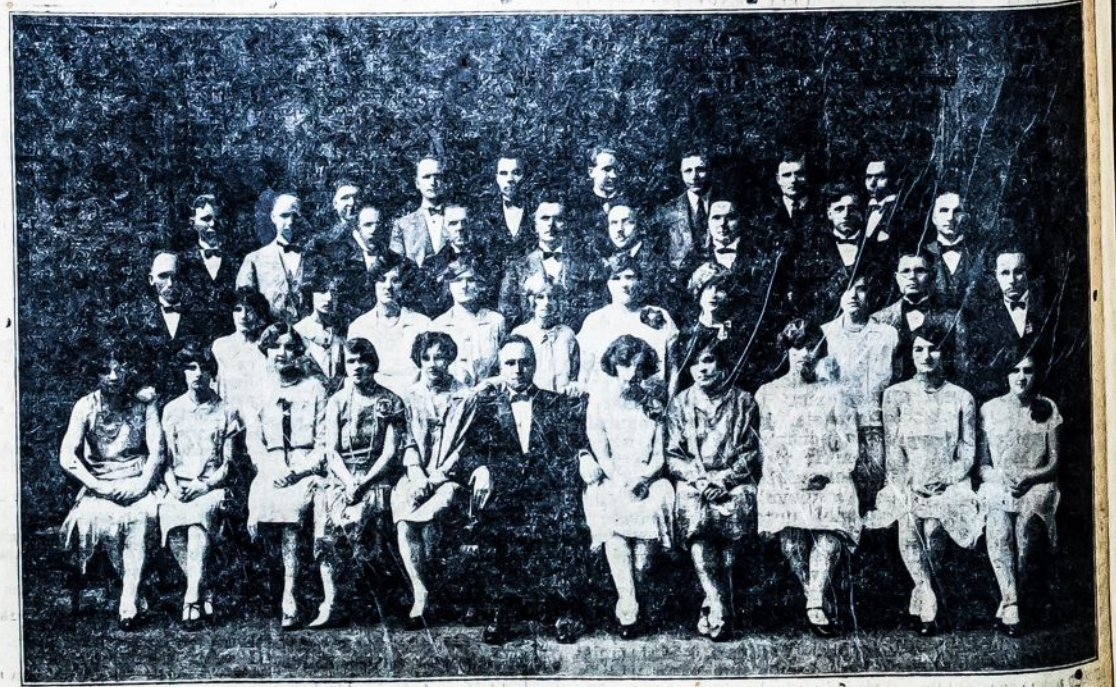
CHORAS "LYRA," Philadelphia, Pa. PROGRAMĄ ISPILDYS:

Didelis su koncertine Programa PIKNIKAS Rengia Philadelphia Lyros Choras Ivyks Nedėlioje, 14 d. Rugpjūčio-August, 1927 VIETA: LAUREL SPRINGS, N. J.