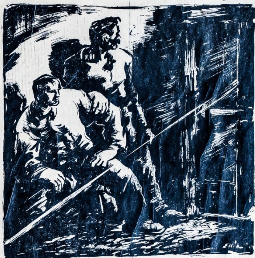
Sacco ir Vanzetti leidžia paskutines gyvenimo dienas mirties kalėjime tarp juodųjų sienų. Jų gyvastis randasi guber. Fuller rankose, bet jie abejoja, ar jis, kaip kapitalistų klasės tarnas, norės išeiti prieš savo klasę, kuri deda visas pastangas juos nužudyti už tai, kad jie yra radikalai darbininkai. Nužudymo diena paskirta 10 d. rugpjūčio.