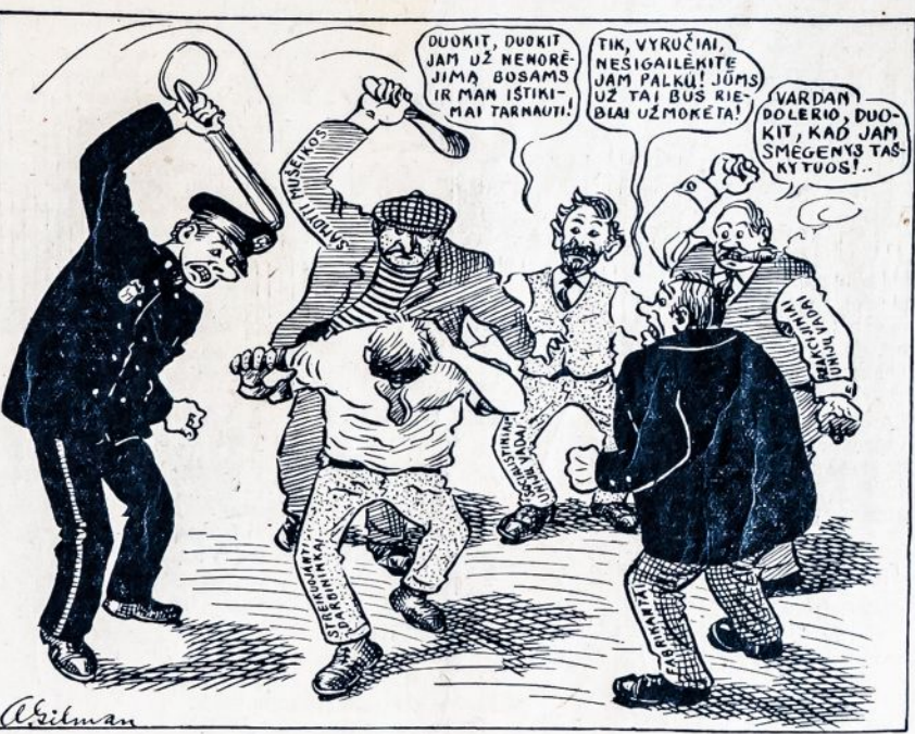
Sunki New Yorko Kailiasiuvių Kova.

ST. PAUL, Minn. — 11 d. liepos prasidėjo vidurvakarinė valstijų fermerių konferencija, kurią suaukė Amerikos ir Minnesotos Agrikultūros Tarybos. Konferencija suvažiavo šimtai fermerių ir rėmėjų McNary-Haugen biliaus teikimui pagalbos fermeriams. Ši bilij buvo priėmęs kongresas, bet prezidentas Coolidge vetavo (atmetė). Konferencijoj svarbiausiu kalbėtoju bus kongresmanas Gilbert N. Haugen, to biliaus tėvas. Konferencijoj dalyvaus keli kongresmanai ir senatoriai.