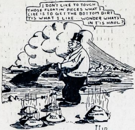
By L. LAUKKONEN.

This picture shows the struggle between Capital and Labor over two workers, Sacco and Vanzetti. Whom do you want to win?