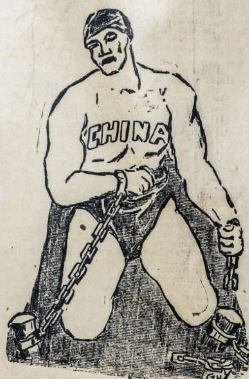
Chinija trauko retežius.