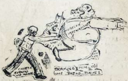
(By Sam Silver)

The Chinese Workers and Farmers are sure socking their bosses in the food container.