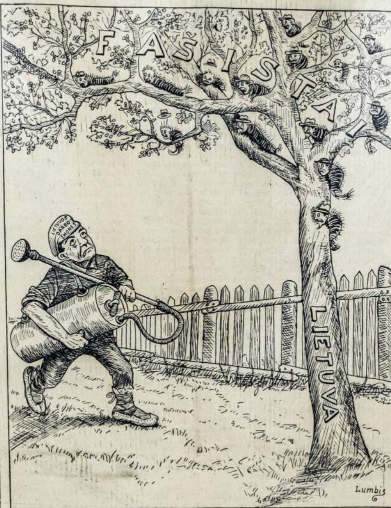
Tik išnaikinę fašistinį brudą Lietuvos darbo žmonės turės daugiau laisvės.