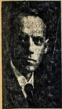
Prof. Scott Nearing

professor talks and the students yawn, doze and take notes. I brought out these facts by careful questioning. After Russia it felt like a visit to the Assyrian Babylonian section of a Museum. The air was dank, musty, stale. Here was youth, enthusiasm, idealism, face to face with a barrage of ancient, meaningless twaddle, badly presented. "What was the effect?" "Don't you ever take more than 16 hours?" I asked. "We don't take any more than we have to." "Why do you take any of it?" "To get a degree, to get a job. You can't teach without it." "How did you come to pick this course?" "Oh, we have little choice. Where we do choose, we take the subjects that require the least exertion." "Is that the way you feel toward your work?" "Yes, bored indifference about expresses it." These young people had studied English for eleven years. They could not write. They were in a "history seminar" but they had no historic perspective. They had eight years of French and could neither speak nor read it. They were studying "philosophy" and were bored to extinction with life. This, in Canada and the U. S. A., is called "education." Taking young, hopeful creatures, and drugging them with scholastic dope until boredom and indifference dominate their lives at twenty. Then people want to know whether the present system will "work"! Scott Nearing.