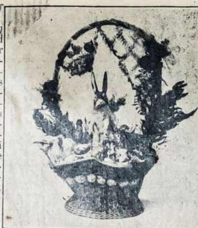
Beskūtė Papuošta Saldainiais

Štai ir Velykos, kurių visi laukiame, nes tai ženklas pavasario, ir kad ištikrųjų turėti linksmas Velykas, tai atei-kite pas mus, nes mes turime puikiausiu Beskūtė visokios rūšies — mažų ir didelių, visos Beskūtės puikiais Saldainiais papuoštos. Juju kaina nuo 5c. iki $25.00. Taipgi turime iš Cokolado išdirbtų visokios rūšies Pankstuku, Žvėrinuku, Orlaviu, Avių ir daugybę kitokjų sutvėrimų.