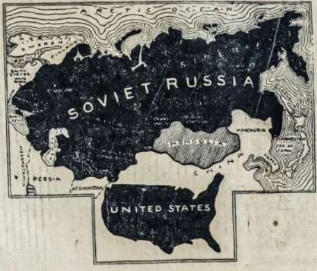
Jungtinės Valstijos yra tik nykštukas sulyginus su Sovietų Sąjunga. (Šitas žemlapis paimtas iš New York Times).

Pierre Doriot, franrūzas komunistas, išvykęs iš Kantonu ir Hankową. Jis Kantonu pasakė revoliucinę prkalbą, ragindamas Indo-Chiniją prisidėti prie nacionalistinės revoliucijos.