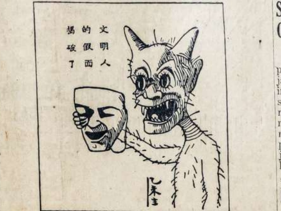
Šitaip chiniečiai persistato plėšrųj imperializmą, prisidengusį "žmoniškumo" ličyna.