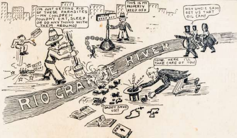
Meksikiečiai nori apsvalyti nuo svetimšalių parazitų.

WASHINGTON. — Senate smarkiai susiginčino senatoriai Copeland iš New Yorko valstijos ir Heflin iš Alabama valstijos del pastarojo pareiškimo, kad Amerikos katalikų organizacijos deda visas pastangas išprovokavimui karo su Meksika. Heflin sakė, jog už šita pareiškimą jam pagromota atimti gyvastis. Copeland stoji apginti katalikus, pajuokdamas Hefliną. Pastarasis atkirto, kad Copeland yra protestonas, bet pataikauja katalikams už jų balsus.