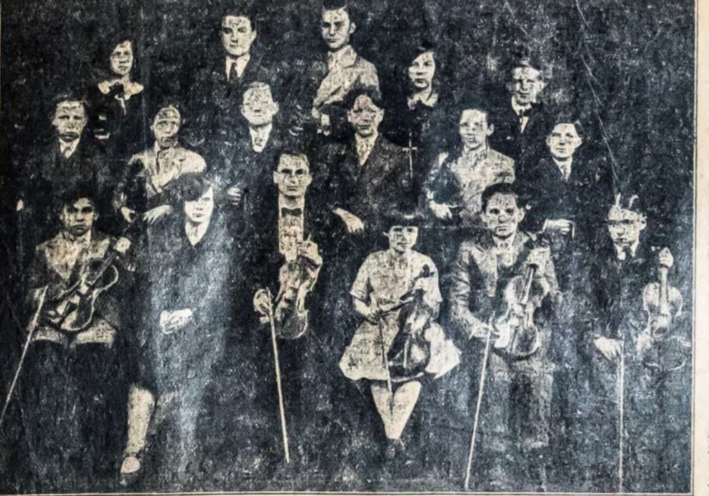
J. Baltrukovičiaus muzikos mokykla, 67 Ten Eyck St., Brooklyn, N. Y.

"LAISVĖS" SVETAINĖJ 46 TEN EYCK ST., BROOKLYN, N. Y.