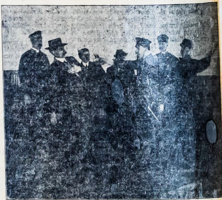
Veikalas "Kolčako Nepasiektas Tikslas" yra geriausias ir gražiausias lietuvių kalboje, nes jis atvaizdina, kaip karo laiku admiralas Kolčakas darė užpuolimus ant Rusijos revoliucionierių ir kitų šalių pagalba žudė nekaltus žmones. Jam sulosti surinkta Philadelphijos geriausi lošėjai iš lietuvių tarpo. Todėl nepraleiskite to vakaro, visi kas gyvas atsilankykite pažūrėti.

Įžanga į tą puikų vakarą tik $1, 75c ir 50c