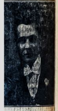
Portrait of a woman, likely related to the Beauty Parlor advertisement.

LIETUVISKA BARZDASKUTYKLA ir BEAUTY PARLOR