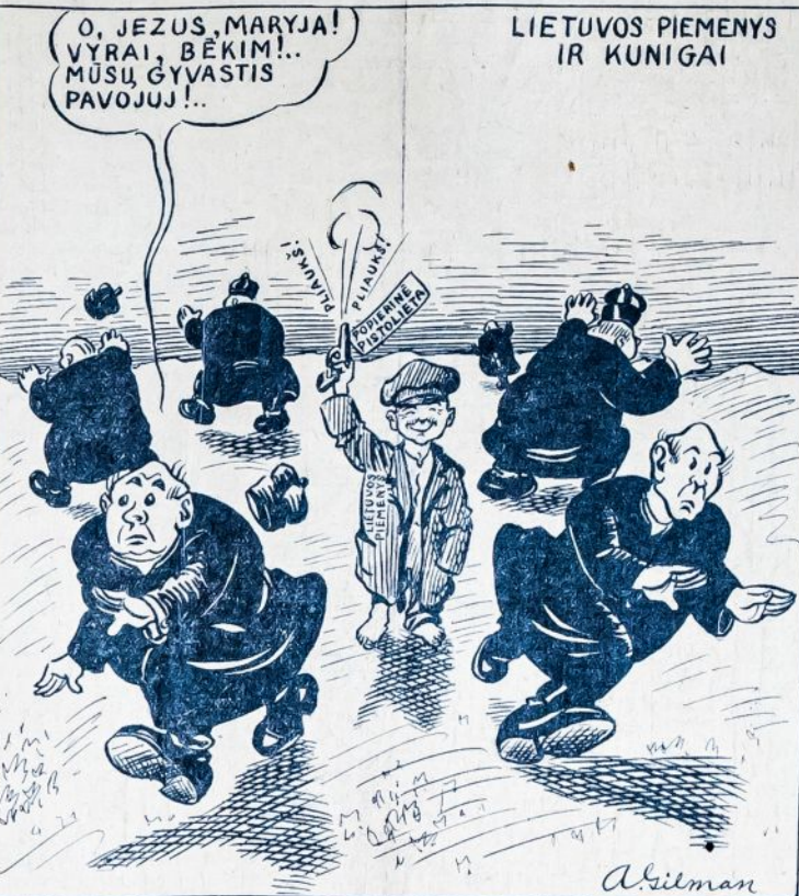
By mažiausias šnipstelėjimas jiems išrodo pasikėsinimu.

Tas klausimas apie pieno negerumą yra paprastas politikierių "trikasas". Apie pieno gerumą gali būti didelių abejonių, bet nei republikonai, nei demokratai to dalyko nepažintys.