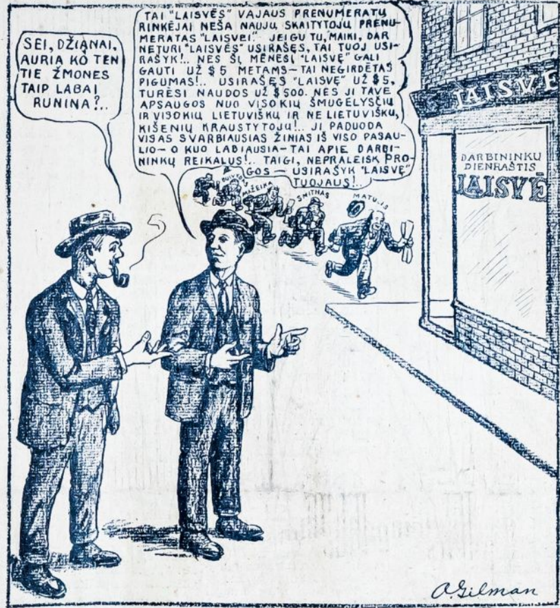
Kuris kurį pralenks?

Perreitą pirmadienį čionai banditai nuzudė tris asmenis, o tris sunkiai sužeidė.