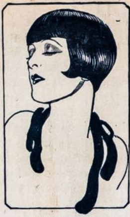
LYA DE PUTTI IN THE PARAMOUNT PICTURE "VARIETY".

Rialto teatre, 42nd St. ir Broadway, New Yorke, yra rodomi krutamieji paveikslai vardu "Variety". Paveikslai pagaminti Vokietijoj. Veiklaas melišikai-tragiškas. Daugiau jame "gyvenimo", negu paprastuose amerikoniškuose paveiksluose. Vyriausią rolę lošia pagarsėjęs aktorius Emil Jannings, tas pats, kuris vaidino veikaluose apie Petrą Didįjį ir Anglijos karalių Henry VIII. Iš fotografijos atžvilgio, šie krutamieji paveikslai yra vieni iš geriausių, kokius teko matyt. Vyriausią rolę iš moteriškų aktorių atlieka Lya de Putti, mažiau Amerikoj pagarsėjusi, bet labai tikrai aktorė.