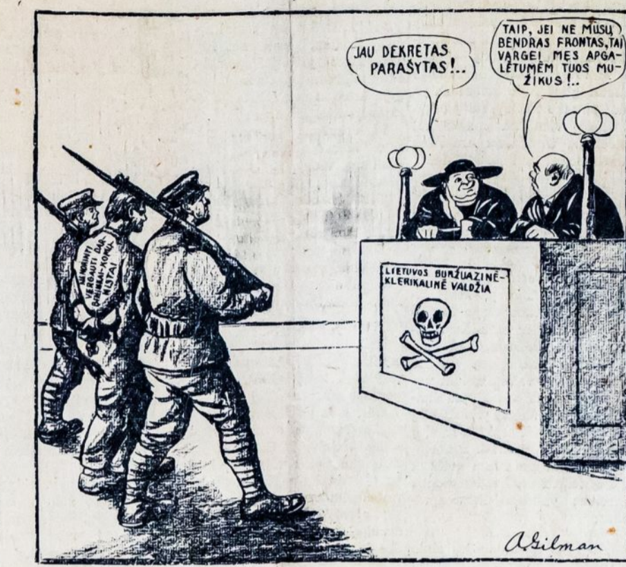
Lietuvos kunigų ir ponų valdžios teismas komunistams.

KIJEVAS. — Keletas kunigų ir piemenų tapo suimta Domidovkos distrikte. Jie kaltinami burtininkavime ir šiaip žmonių viliojime. Du piemenys tvirtino tamsiems valstiečiams, kad jiedu matę danguje Kristaus veidą, apšviestą aureole šviesos. Užgirdę tas pasakas, kunigai tuojau suruošė atvirame lauke pamaldas ir pradėjo