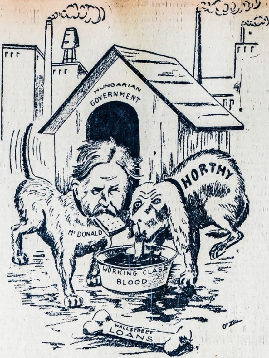
Remiamas Amerikos kapitalistų, su tyliu "socialistų" pritarimu, Vengrijos diktatorius Horthy laka darbininkų kraują.