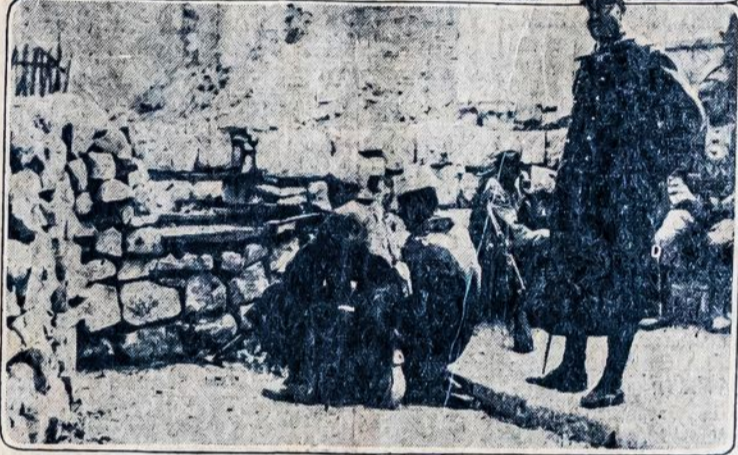
Sie paveikslai nuimti iš Damasko miesto, kame drauzi di dvyriskai kariauja prieš Francijos imperialistus. Tūkstančiai druzų tapo iškersta, o garsusis Damasko miestas gerokai apgrautas.