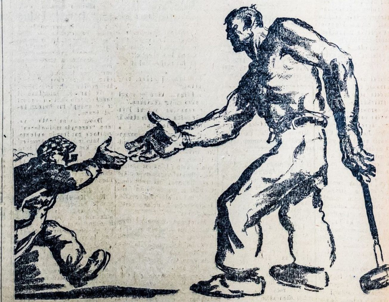
Laisvos Rusijos darbininkas ištiesė ranką pasitinka kapitalistinių šalių darbininkus, kurie trokšta tarptautinės proletariato vienybės.

Paryžius. — Iš Turkijos atinciančios žinios skelbia, kad Angoros vald. mano nutraukti ryšius su Irak karalija del to, kad Tautų Lyga nutarė prijungti Mosulą prie Irako. Anglija turi uždejuoti savo "globa" ant kalbamos karalijos.