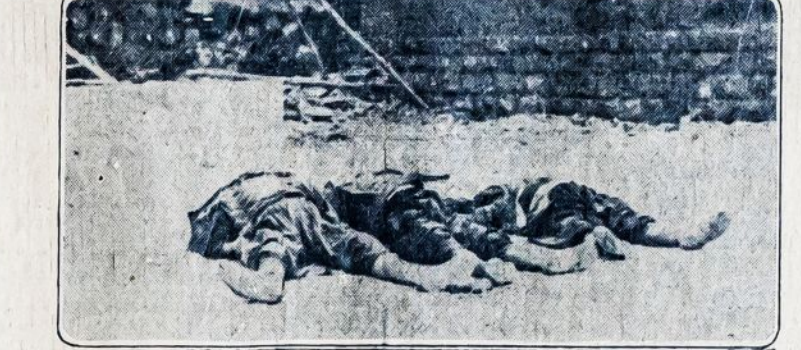
Paveikslėliai paimti iš Damasko miesto, kurį Francijos kariuomenė dikčiai apardė, išskersdama daugybę gyventojų.