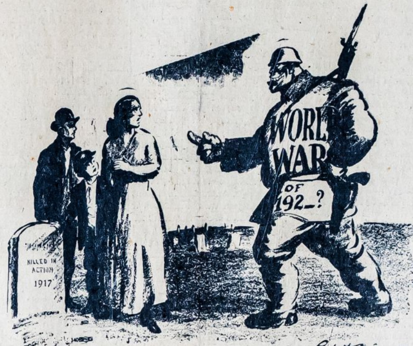
Naisė su siratomis nuėjo atklyt kapą savo vyro, kuris žuvo pasauliniame kare, 1917 m. Bet prieš josios akis atsistojo kitas karas, rušiamas kapitalistų, kuris grumoją josios augantiems vaikams. Sekantis karas bus dar bai senis už pastarąjį.