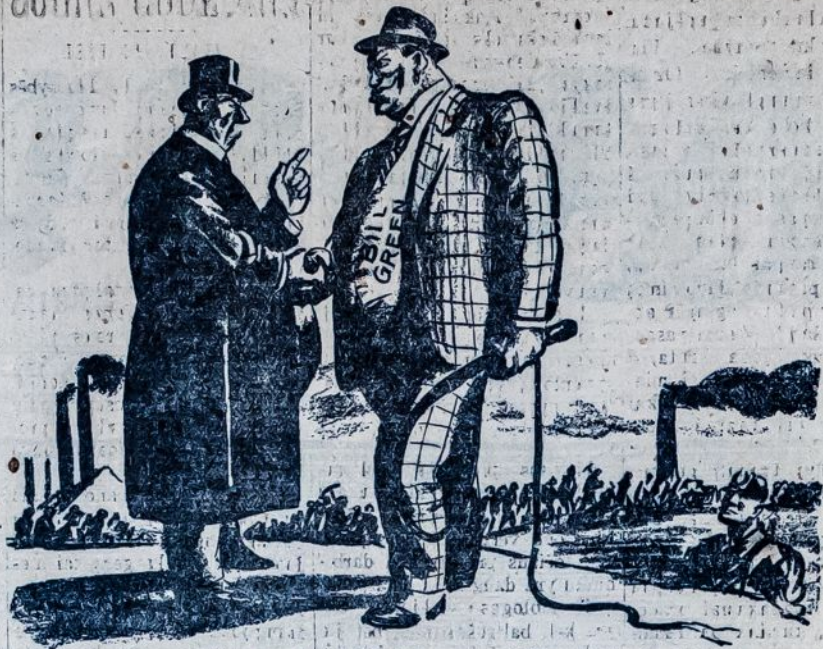
Geltonieji darbininkų vadai, tokie kaip Greonas, Amerikos Darbo Federacijos prezidentas, tarnauja, kaip kapitalo bizonai delei darbininkų paplakimo.

Įvairių šalių darbininkai įsitikino iš savo delegacijų, apsilankusių Sovietuose, jog Sovietų Respublikoj darbininkai ir valstiečiai yra savo gyvenimo viešpatiai; jog didžiais šuoliais jie ten stumia pirmyn savo pramonę; jog jų gyvenimas kas savaitę, kas mėnuo gerėja, ir jog jau šiandien Sovietų šalyj darbo žmonės geriau gyvena, negu bent kurioj kapitalistinėj valstybėj Vakarų Europoj. Sovietų darbininkam vis šviesiau spindi dar geresnio rytojaus žvaigždė, — kuomet kapitalistinių Europos kraštų darbininkam prieš akis dunkso vis bjaurėjantis buržuazinis pragaras, toj, kol jie nesuįtikins kapitalistinės valstybės galią ir patys nesukurs Sovietinėj tvarką.