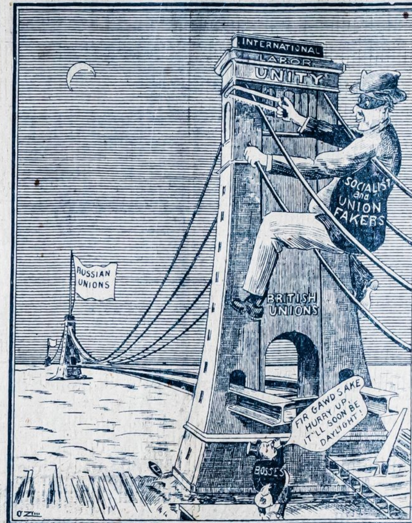
Štai jungiasi Pasaulio Darbininkų Vienybės Tvirtovė—Anglijos Darbo Unijos ir Rusijos Darbo Unijos jau sudarė tos vienybės ryšius, bet pasidavėliai unijų vadai, sulyg įsakyto kapitalistų, stengiasi tą visą ardyti.

LONDONAS. — Pastaromis 24 val. Anglijos pakraščiuose, manoma, pražuvo apie 18 jūreivių, dirbančių ant mažų laivelių, kurie taipgi tapo vėtrog sunaikinti.