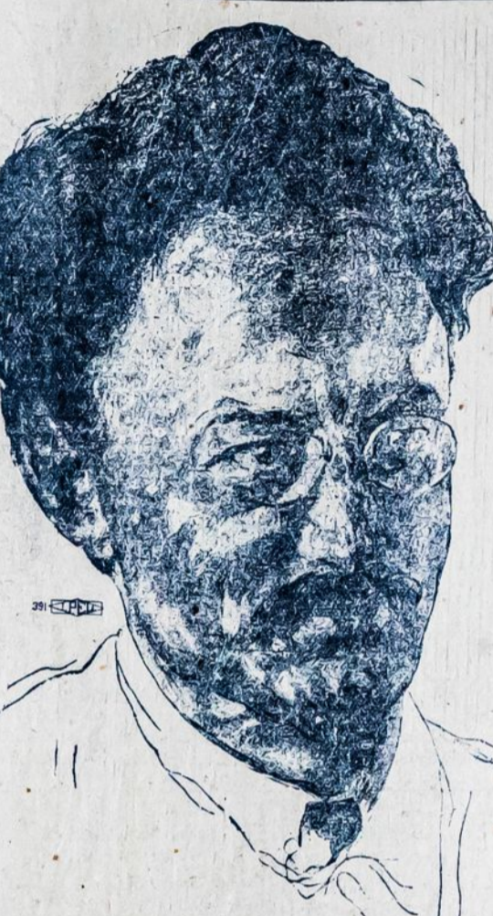
Leonas Trockis, buvusias karo komisaras SSSR, kuris neseniai parašė labai žingeidią knygą, "Kurlink Eina Anglija?", pranašaujanti greitą revoliuciją Anglijoje.

WASHINGTON. — Darbo departamentas šaukia konferenciją apsvaistymui reikalų moterų ir dirbančių įvairiose industrijose. Konferencija įvyks sausio 18 d., 1926.