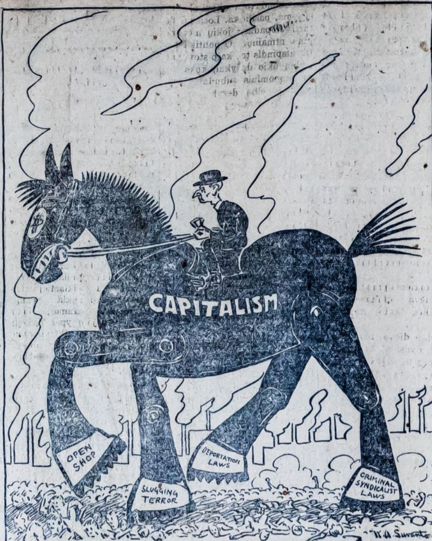
Amerikos kapitalizmo žirgas. Jį kėrvoja kapitalistinė valdžia su prez. Coolidge'iu priešakyje. Jis pakaustys terorą, streiklaužyste ir žiauriais įstatymais prieš darbininkus.

Kur tik buržuazijai pasidaro striukė, visur ji pasišaukia talkon socialdemokratų vadus, kaipo sukčiausius darbininkų monytojus ir tikriausius proletarinės revoliucijos budellus.