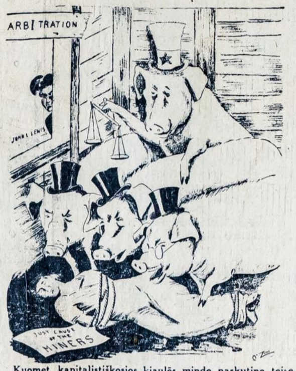
Kuomet kapitalistiskosios kiauless mindo paskutinę teisę mainierų, tai pastarųjų unijos vadus, pasislėpęs už arbitracijos kampo, sau ramiai žiūri.

9. Suherkim visi rankas per šias kelias dienas ir atlikim savo pareigas. Draugai, kurie dar nėra pasidaravę dienraš- čiui — dabar turi tai atlikti.