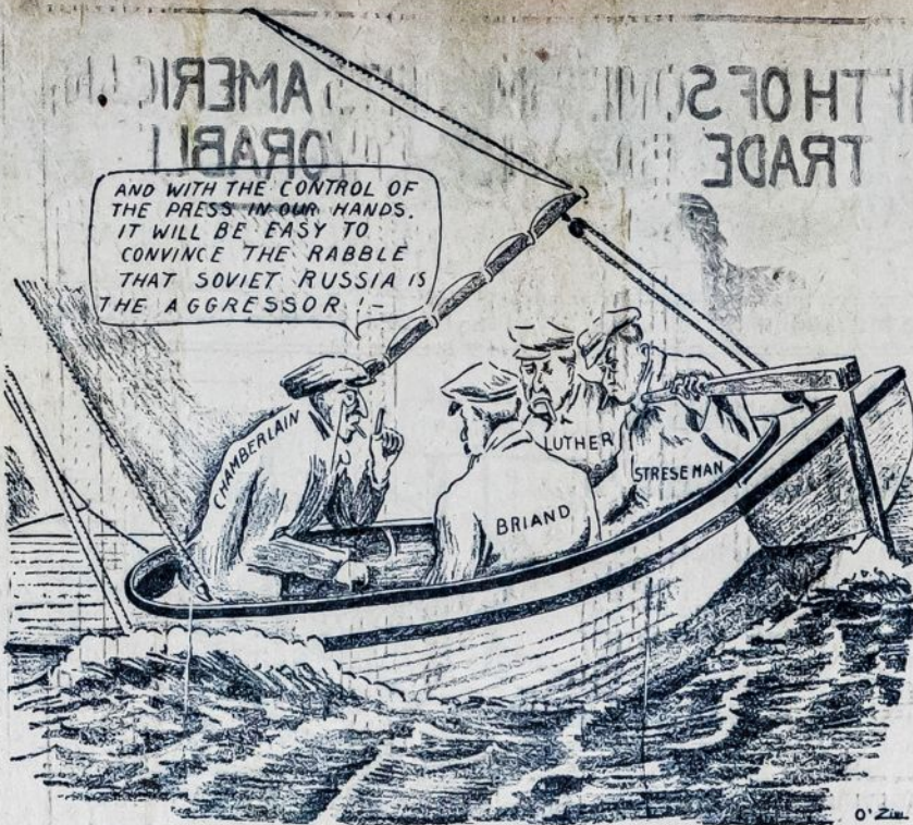
Audros blaško buržuazinių valstybių laivą — Anglijos, Francijos ir Vokietijos. Bet jų politikieriai daro suokalbį užpult Sovietų Rusiją. O savo žmonėms, girdi, pasakysime, kad Sovietai mus užpuolė.

Taigi, galų gale, ir Amerikos darbininkai susilauks teisingų, tiesioginių žinių nuo savo draugu, kada šie sugrįš su raportais iš naujo, proletarinės tvarkos pasaulio.