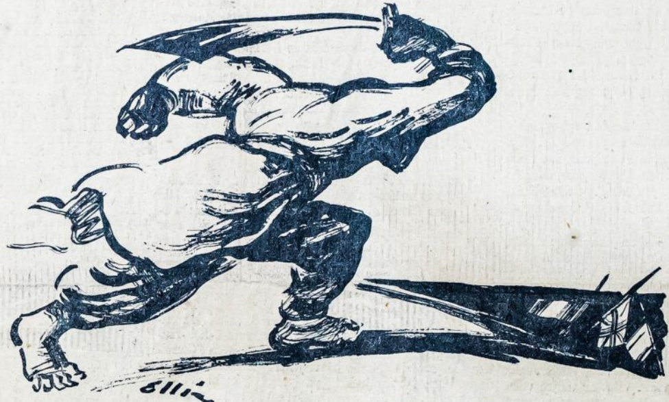
Chinijos milžinas (liaudis) pabudo ir paėmęs ginklą valo juomi savo šalį, veja laukan pasaulio imperialistus — Angliją, Japoniją, Franciją ir kitus.

"Laisvė" kovoja prieš išnaudotojus ir visus tamsybės apaštalus. Delei to ji turi daug priešų išnaudotojų abazę. Bet darbininkai remia "Laisvę". Šiuo tarpu ta parama yra reikalingiausia.