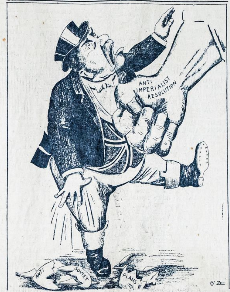
Darbininkų klasės griežtas protestas ardo planus pasaulio imperialistų, norinčių pulti ant SSSR.

New York. — Paskiausios skaitlinės skelbia, kad 5 asmenys tapo užmušta, o 19 suzeista didelės vėtrės, kuri siautė pereitą šeštadienį šioje apielinkėje.