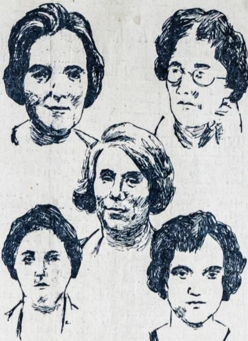
Anglijos Darbo Unijų delegatės Sov. Respublikoje. Sugrįžę iš ten, jos labai gyrė SSSR. tvarką.