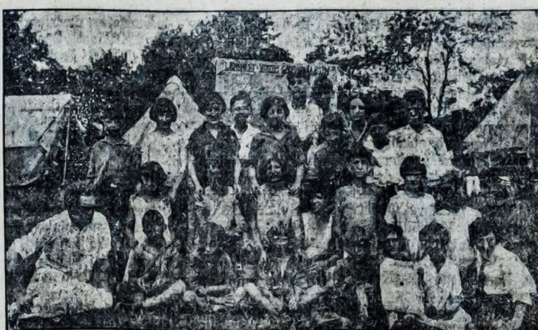
Leninistų jaunuolių kempė — New Yorke.

Amerikos Lietuvių Darbininkų Literatūros Draugijos agitacijos mėnesis prasidėjo su 1 d. spalį ir tęsis per visą mėnesį. Turėsime gražaus laiko gauti nors po vieną naują narį į organizaciją. O tai nesunku atlikti, tik reikia pasidarbuoti.